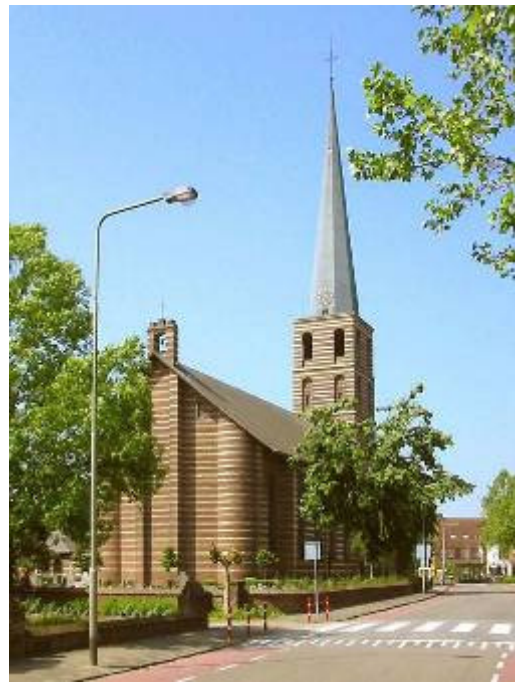
1955 - hōjje

Um half neege waar de wichtermis. Alle wichter van de jónges- èn dōrskessjool mooste dōrhin. Alle ónderweezjers èn ónderweezjeresse zaate ók in de wichtermis. Die mooste dervur waake dè 't hier òf dōr nie utj de haand liep. Awwere mènse moochte der nie in, éne éneke utjgezónderd, die vanwege gezinsumstandigheeje nie nò 'n ander mis koos. Min vaader ging aaltidj as ónderweezjer nò de wichtermis èn ging dōrnao ók nòg nò de hòmmes um tien uurre. As weecht kwaame ge nie in de hòmmes. Toen waar nòg dè de vròllie links zaate èn de maanslui rèèchts. De vròllie han de sjònste klieër èn die weeste dètter nò ur gekeeke woor. Ze mooste allemòl éne hoed draage. De maanslui han 't sòndese pak èn. Iedder gezin haa ieën òf twee platse gepaacht in de kéérek. De kéérek waar goe vól èn dikker mooste mènse stao, umdè ze gén plats mèr kooste kriege.