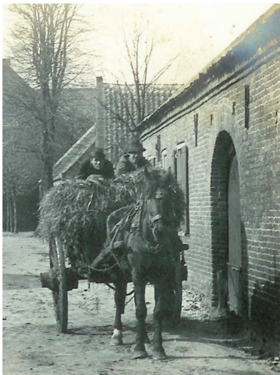
Paardenkar in 'de straat' rond 1900.