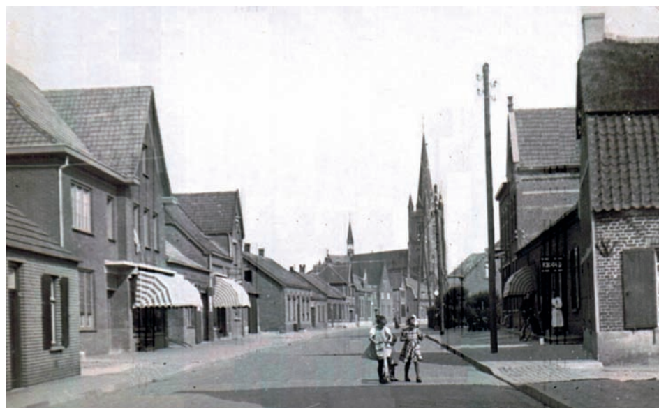
De Dorpsstraat ca. 1938.