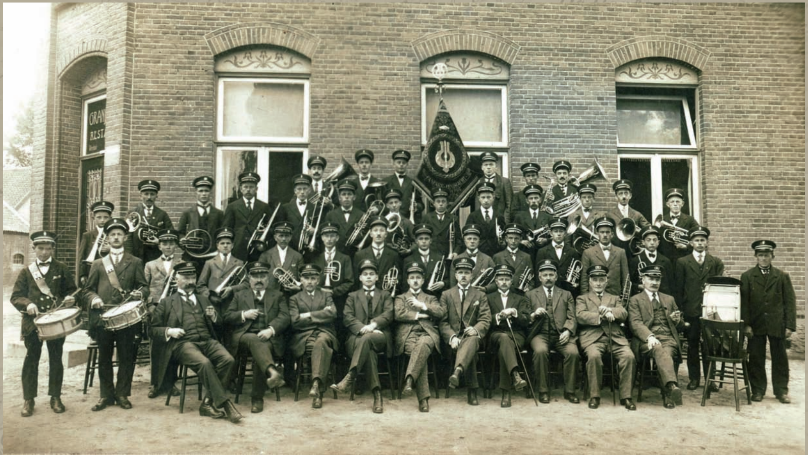
Fanfare Eendracht in 1921 voor het hotel dat sinds 1919 hotel Oranje heet.