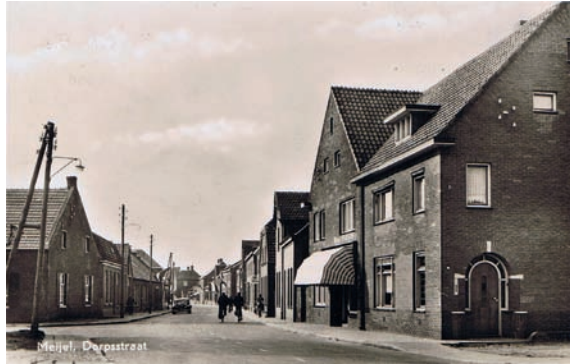
De Dorpsstraat in 1950.