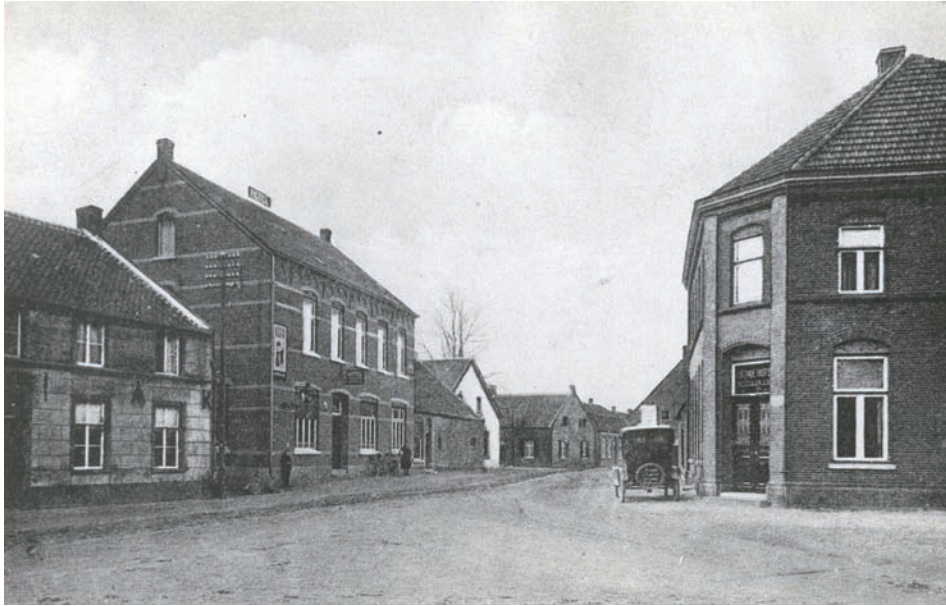
De Dorpsstraat in 1925 tussen hotel Joordens en hotel Oranje.