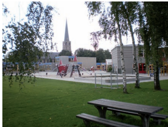
De Brede School in Meijel met kinderopvang.