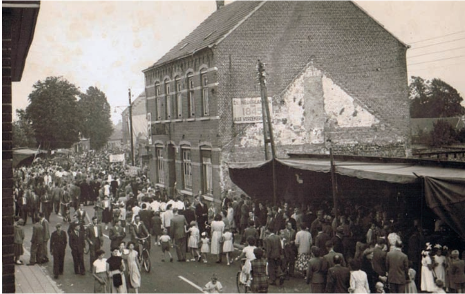
OLS 1955 Meijel, rechts hotel Ketels, daarnaast en links op parkeerplaats van hotel Oranje tenten voor dans en drank.