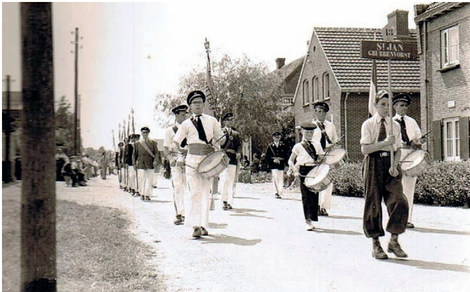
OLS 1955. Schutterij St. Jan uit Grubbenvorst, winnaar OLS 2009.