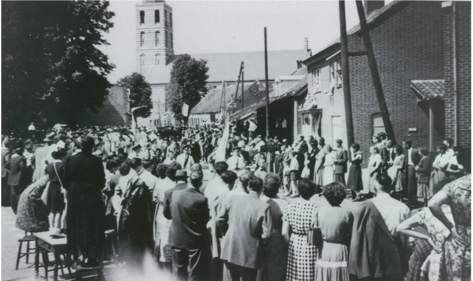
OLS Meijel, dikke rijen toeschouwers in de Schoolstraat.

Kerkkoren, Harmonie, Toneelvereniging COM, Carnavalscomité De Kieveloeët, congregaties, Missiecomité en muziekgroepen. De meeste verenigingen waren in de jaren vijftig nogal 'kerkgericht'. De kerk, liever het kerkbestuur, had toen in Meijel nog de zorg voor onderwijs, ouderen en verenigingen. Naast de scholen en het bejaardenhuis was het voetbalveld aan de Jan Truijenstraat eerder bezit van het kerkbestuur, zoals ook het patronaat tot stand kwam via dit bestuur. Tenslotte waren er natuurlijk de brandweer en de standsorganisaties van middenstand, boeren en arbeiders. Het aantal verenigingen lijkt, gezien vanuit 2009, al erg beperkt, maar met de accommodaties was het nog kariger gesteld. Het voetbalveld lag met een klein kleedhok nog