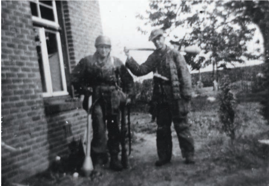
Twee jonge, zwaar bewapende, Duitse militairen gefotografeerd in de Molenstraat op 25 september 1944. Enkele uren later zouden ze niet meer leven.