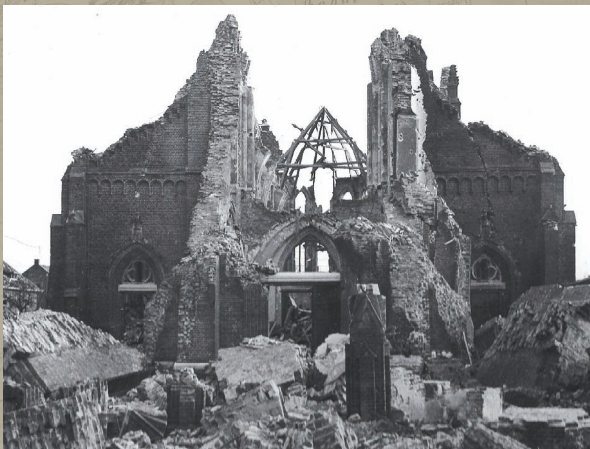
Deze enorme puinhoop resteerde van de 'kathedraal van de Peel'.