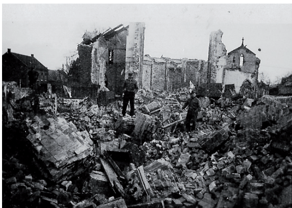
De ruïne van de kerk.

Meijel stak de armen uit de mouwen, de wederopbouw werd ter hand genomen. Besloten werd om de kern van Meijel geheel anders in te richten en de zaken grondig aan te pakken. Er kwam een nieuw bestemmingsplan dat voorzag in verplaatsing van de boerderijen uit de kern in het kader van een grote ruilverkaveling.