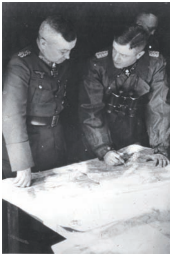
Veldmaarschalk Walter Model (links).

Op 17 november 1944 trokken de Duitsers zich terug uit het dorp, deze keer voorgoed, er was voor hen geen houden aan. Het dorp en de omgeving lieten ze als één groot slagveld achter. Overal lagen uitgebrande wrakken, her en der waren soldaten