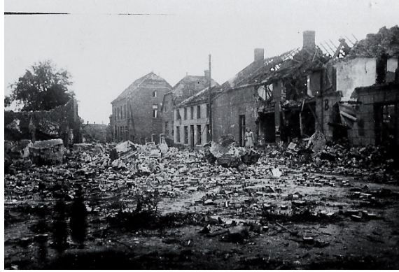
Oorlogsschade in de Schoolstraat na het opblazen van de kerk.

(ook bij Helenaveen) en overrompelden Meijel om vervolgens snel op te stomen naar Liessel, Ospel en Heusden. Volgens de BBC was ‘the battle of Meijel very heavy, the heaviest since the Normandy’.