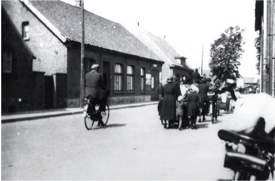
De Meijelse bevolking evacueert naar Asten op 10 mei 1940.