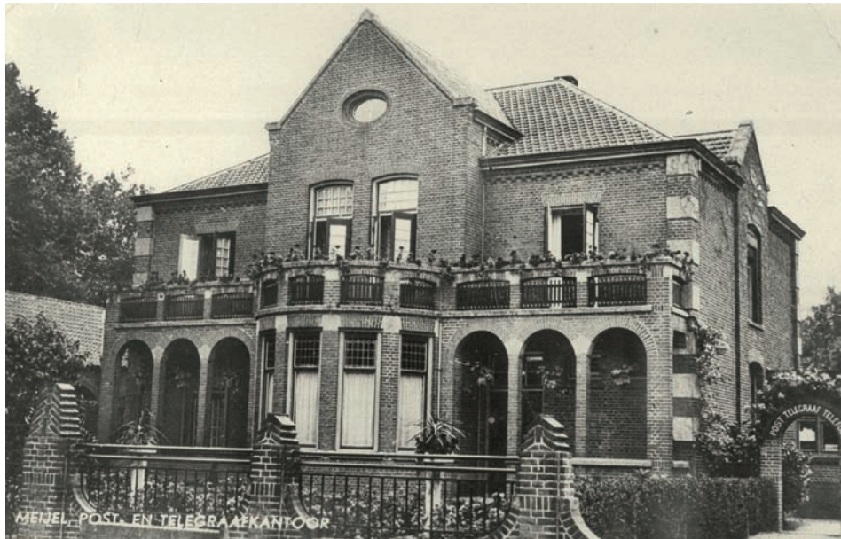
Villa Truijen uit 1882.