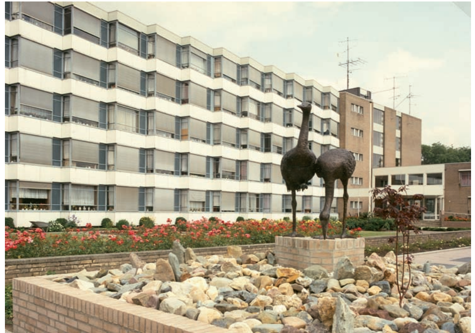
De Kraanvogels voor het bejaardenhuis (foto 1993).