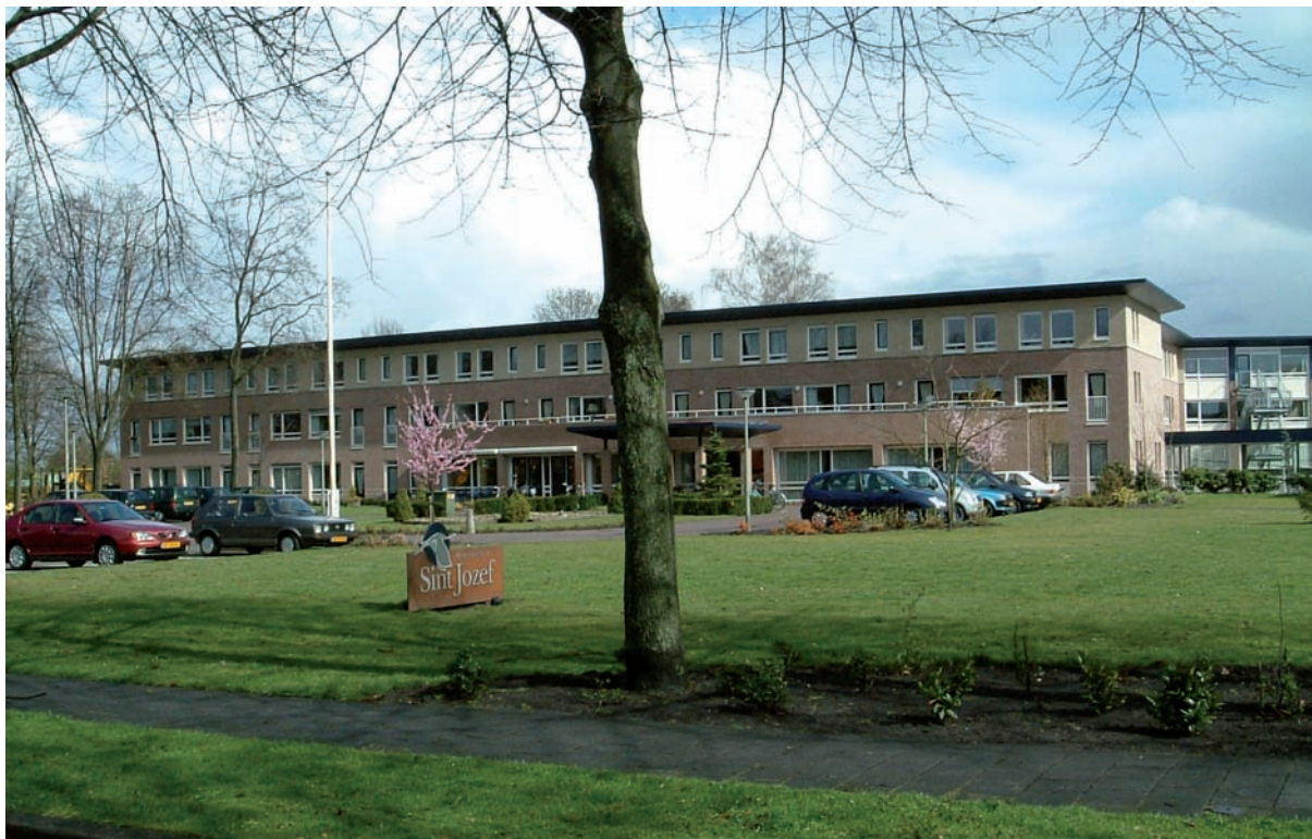
Zorgcentrum Sint Jozef.