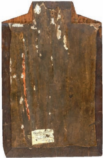
Achterkant van de Kruisiging.

aan een zeer aanzienlijken prijs van de hand mogt worden gedaan'. CleEVERS werd aangeraden om zowel bij verkoop als restauratie zeer voorzichtig te werk te gaan. De opgeplakte papiersnipper aan de achterkant met als tekst 'Eigendom [der] kerk [Stuk] van Waarde .... de Oude Hollandsche [school]' is wellicht aangebracht door deze deskundigen; het handschrift is in elk geval laat 19 de eeuw.