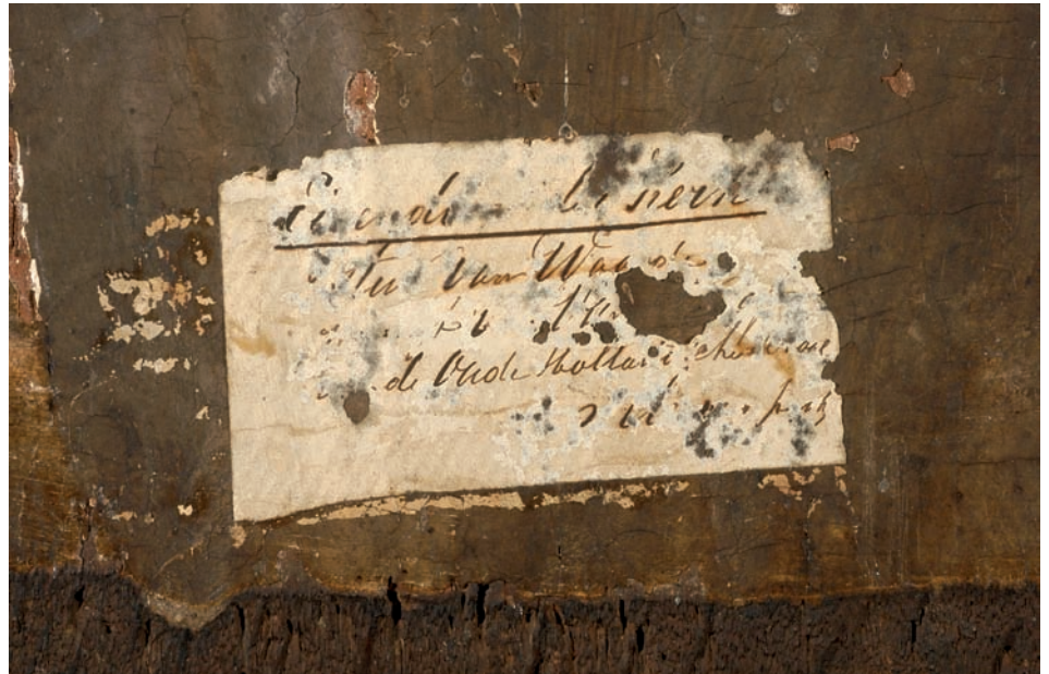
Papieren notitie op de achterzijde van het paneel.

Aanknopingspunten voor het bepalen van maker, c.q. atelier, en jaar van ontstaan van het Meijelse paneel vormen details zoals de wijze waarop Jeruzalem is uitgebeeld, het type Maria, het rotsachtige landschap, de uitvoering van de boom rechts en vooral de figuur van Johannes de Evangelist. Met name het ‘verkort’ in diens linkerarm en zijn ‘moderne’ contrapost-houding vallen op, evenals de losse techniek waarin zijn bovenmantel is geschilderd en de knoop op zijn schouder. Maria is daarentegen veel ‘stijver’ weergegeven terwijl de schuin naar achter lopende weg uitgesproken zwak is geschilderd (hij lijkt nog