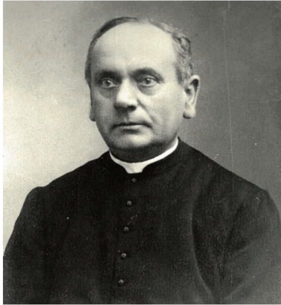
Pastoor Peter CleEVERS (Weert 1827 - Meijel 1896).

kruisigingen. Typisch voor hem zijn de verticale, grillige rotspartijen in het landschap en de plechtige ingetogenheid, waarmee hij de Brugse traditie voortzette. Beide elementen treffen we in de Meijelse Kruisiging aan. In het Los Angeles County Museum bevindt zich een kruisiging die qua compositie en in de uitbeelding van de stad, de weglopende meute en het type weg, sterk verwant is aan het Meijelse paneel. Een probleem rond Isenbrant is wel dat diens oeuvre het karakter heeft van een vergaarbak. Toeschrijving van werk aan hem op grond van stijlovereenkomsten met ander, aan hem toegeschreven werk is nogal hachelijk omdat het gevaar van 'lintvorming' dreigt. Tenslotte moet hier ook het atelier van Joos van der Beke (naar zijn geboortestad ook Van Cleve genoemd) uit Antwerpen worden genoemd, één van de z.g. Antwerpse maniëristen. Van Cleve (1485-1541) wordt in 1511 genoemd als lid van het Antwerpse kunstenaarsgilde. Hij was actief tussen 1510 en stierf in 1541 in de Scheldestad. Aan zijn atelier wordt een groot aantal devotiepanelen toegeschreven, met als meest voorkomend onderwerp Maria. Verwant aan het Meijelse paneel is o.a. een kruisafname van Van Cleve in