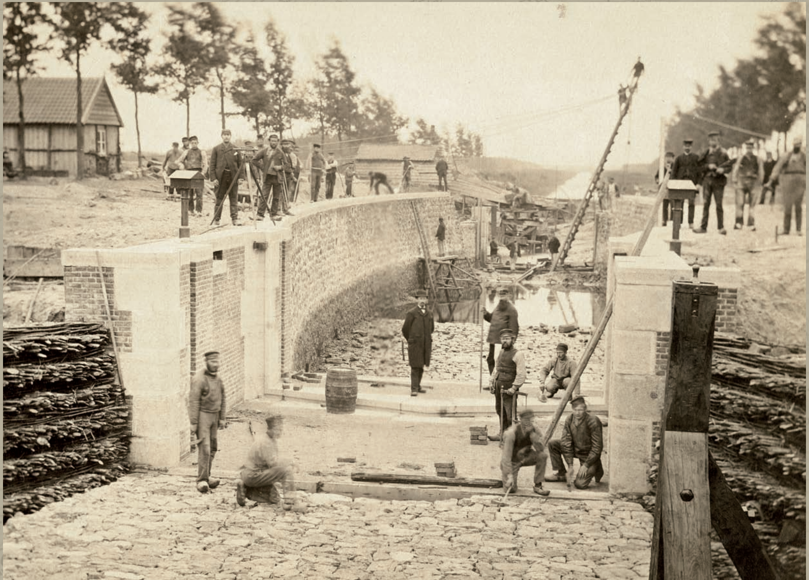
Unieke opname van de aanleg van het sluisje in het Afwateringskanaal onder Meijel. Datum: oktober 1884. Wie zouden toch die bouwvakkers zijn?