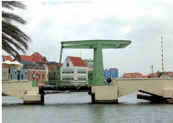
De brug over de Noordervaart ligt nu in Willemstad op Curaçao.

Hoewel daarover nu terecht anders wordt gedacht door natuurbeschermers, betekende de Peel in het verleden allerm minst een zegen voor haar bewoners. De Meijelse bestuurders hoopten dat Helenaveen een oplossing bood voor de vele Meijelsen die geen werk hadden en daarom moesten worden bedeed door het armbestuur.