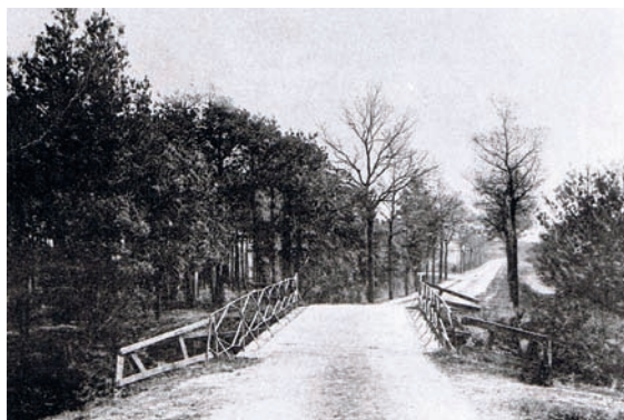
De hoge brug over de Helenavaart in 1906. We kijken in de richting van Beringe.