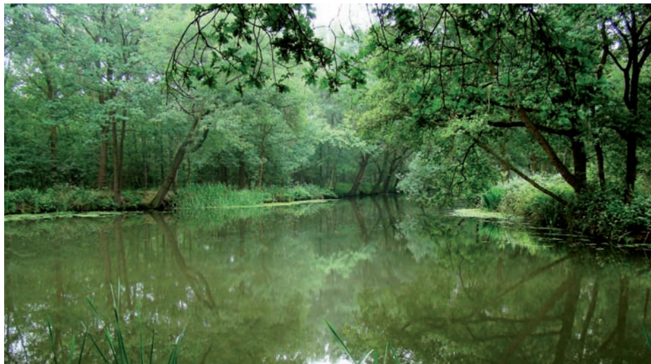
Fraaie blik op de Helenavaart anno 2009.

waardoor het varen voor zowel de beroepsvaart als de recreatievaart niet prettig is. De Noordervaart dient daarom slechts voor de doorvoer van water dat vanuit de Maas via Lozen wordt aangevoerd.' (website Rijkswaterstaat).