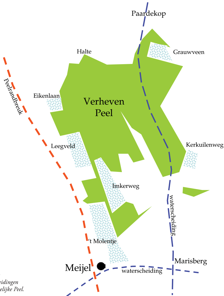
Figuur 2: Waterscheidingen in de oostelijke Peel.

Het vierde gunstige geologische kenmerk is dat op