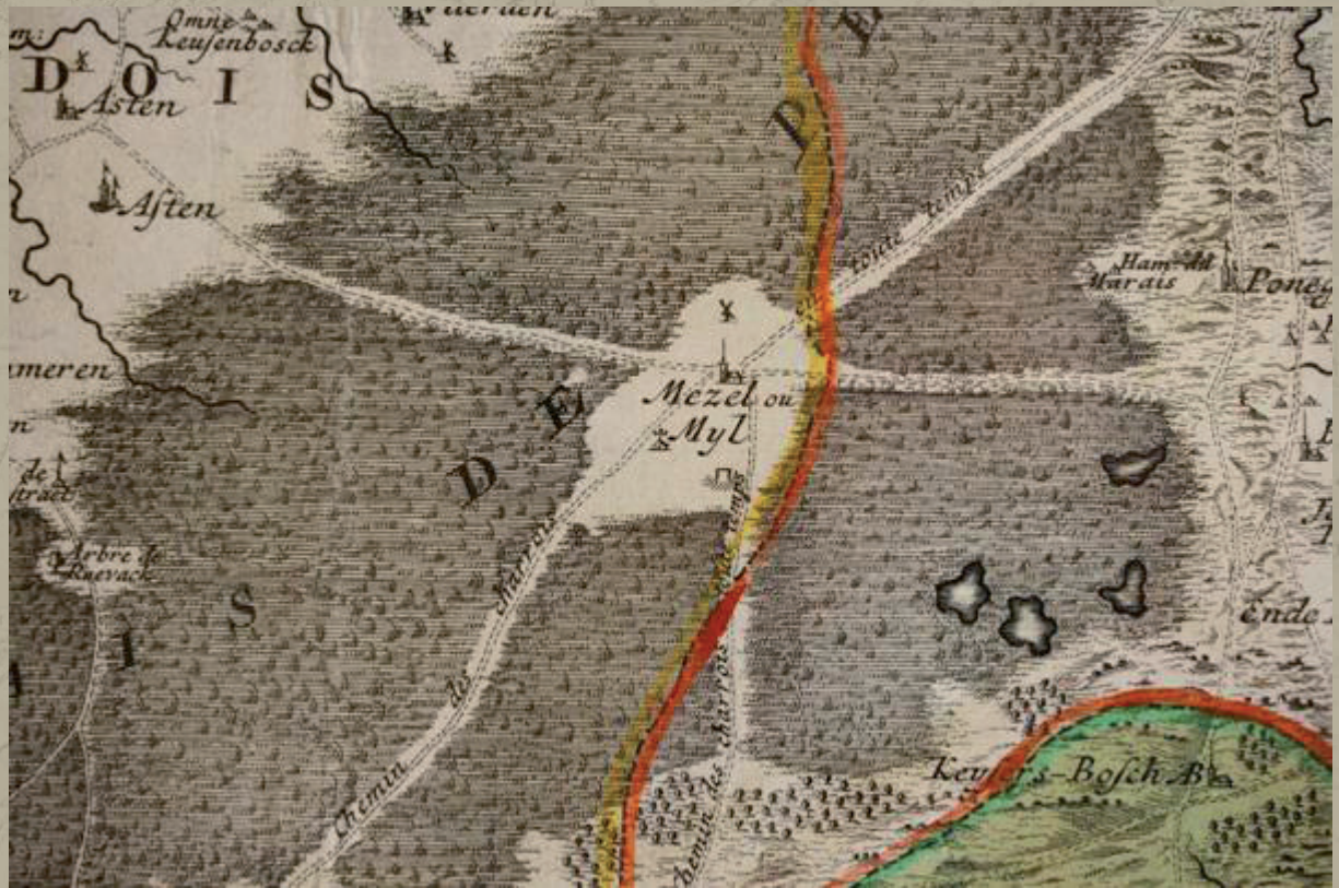
Meijel in de Peel, ca. 1750.