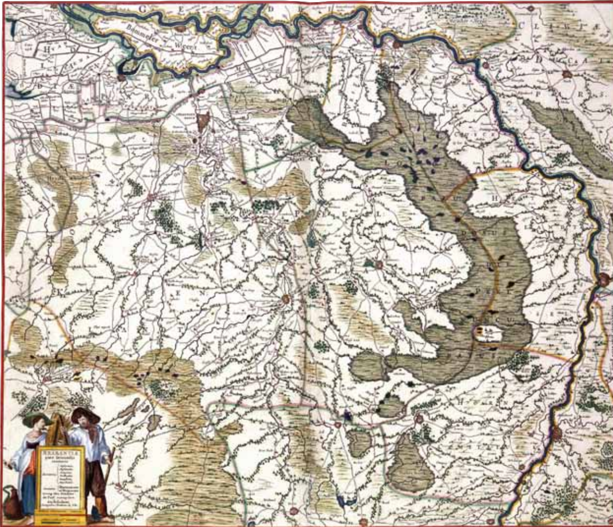
Kaart oostelijk Brabant, door Frederik de Wit, ca. 1680.

Maar die -j- kan er ook niet zijn en dan krijg je een vorm als Meele . Overigens kunnen de vormen met -d- nog tot 1471 blijven bestaan, zoals we gezien hebben. In de huidige officiële uitspraak Meijel hoort men die overgangsklank -j- wel.