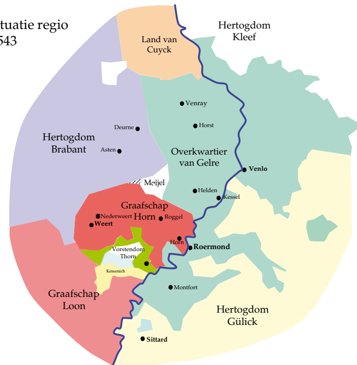
Politieke situatie regio Meijel in 1543