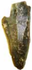
Fraaije, vuurstenen afslag uit het Midden-Paleolithicum.