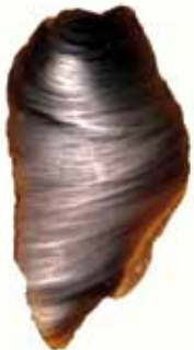
Tjonger-cultuur, schrabber gevonden in het Peelke.

en Nederland werd aangetroffen. Deze traditie kent een oudere component die teruggaat tot het Vroeg-Saalien en een jongere component, die op enkele plaatsen ook nog in het Eemien te vinden is. In hun totale "habitus" vormen ze de voorboden van het vrij veelvormige Moustérien uit het Laat-Eemien en het Vroeg-Weichselien. In relatie tot deze middenpaleotraditie werd ook gesproken over het "Moustérien ancien".