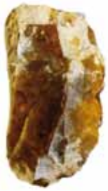
Midden-paleolitische krabber uit Meijel.