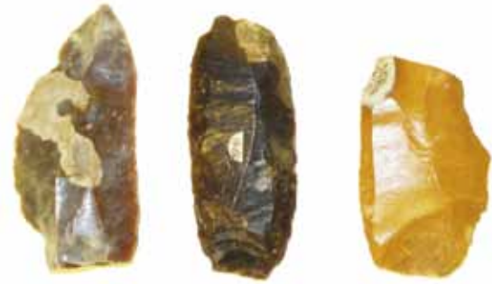
Middenpaleolitische boor en krabbers.

Op de periode van het jongpaleolithicum volgt het mesolithicum (8300-4000 v. Chr.). Na de laatste ijstijd verbeterde het klimaat. Het werd warmer en het landijs in het noorden begon te smelten. In onze streken ontstaan moerassen. Het is in deze tijd dat de Peel als kolossaal moeras, als hoogveengebied, gestalte begint te krijgen. In deze tijd ontstaat het gebruik van pijl en boog. Er komen steeds meer bossen. De mens wordt minder jager-zwerver. Door het groeien van het Peelmoeras werden de toenmalige bewoners in het Peelgebied gedwongen naar de hoger gelegen randen van de Peel te verhuizen bijvoorbeeld de Amstelberg en