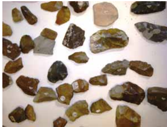
Middenpaleolithische artefacten uit Meijel.