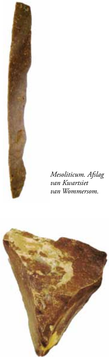
Mesolithicum. Afslag van Kwartsiet van Wommersom.

Uit het voorgaande blijkt dat de Meijelse geschiedenis teruggaat tot in het verre middenpaleolithicum, ± 200.000 jaren geleden. Stille getuigen van die geschiedenis zijn slechts vuurstenen artefacten of afslagen. Naarmate we dichterbij het begin van onze jaartelling komen, komen er steeds meer historische tekenen. Door vergelijkbare vondsten elders en landelijk onderzoek krijgt de prehistorie van een dorp als Meijel toch duidelijker contouren.