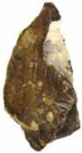
Midden-paleolitische afslag (boor).