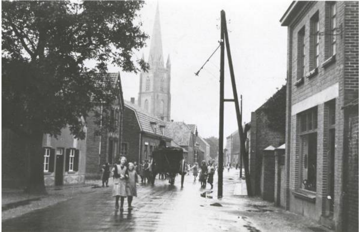
Met de turfkar door de Dorpsstraat van Meijel, het is voorbij.

Voor de turfstecker zal bij zijn zware arbeid de natuurlijke omgeving in de Peel niet op de eerste plaats het onderwerp van zijn aandacht geweest zijn.