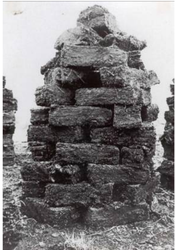
Schrank of sjrangk

Op het droogveld werd de turf in sjrèngk gezit , in ronde hoopjes die naar boven toe taps uitliepen in de vorm van bijenkorven. Ongeveer 50 turven gingen in een sj-rèngske . Na enige tijd in zo'n schrankjes gestaan te hebben, werden de turven in énne groeëte sjrangk gezit . Stukken en brokken werden binnenin gelegd, zodat de hoop gevuld was. Met de kaar bracht men de gedroogde turven in september naar huis in de törrefsjop , de turfschop.